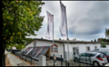
BERLIN - RUDOW

📍 Fürstenwalder Damm 435-441 12587 Berlin ☎ 030 641917-0