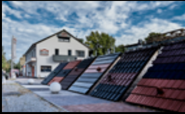
BERLIN - TEGEL

📍 Seidelstraße 31 13507 Berlin ☎ 030 435604-0