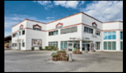
BRANDENBURG - VELTEN

📍 Kanalstraße 76-78 12357 Berlin ☎ 030 666239-99