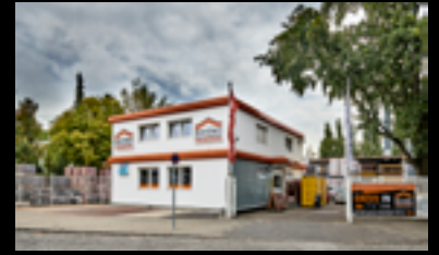
BERLIN - LICHTERFELDE

📍 Feldtmannstr. 152 13088 Berlin ☎ 030 927033-0