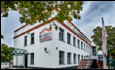
BERLIN - KÖPENICK

📍 Giesensdorfer Str. 1 12207 Berlin ☎ 030 772046-0