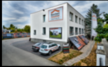
BERLIN - WEISSENSEE

📍 Seidelstraße 31 13507 Berlin ☎ 030 435604-0